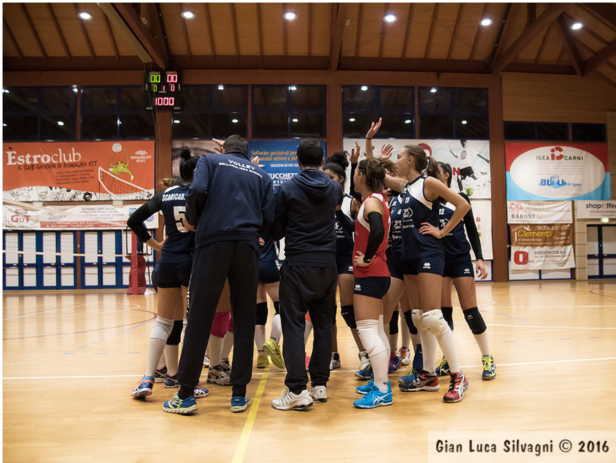
Gian Luca Silvagni © 2016