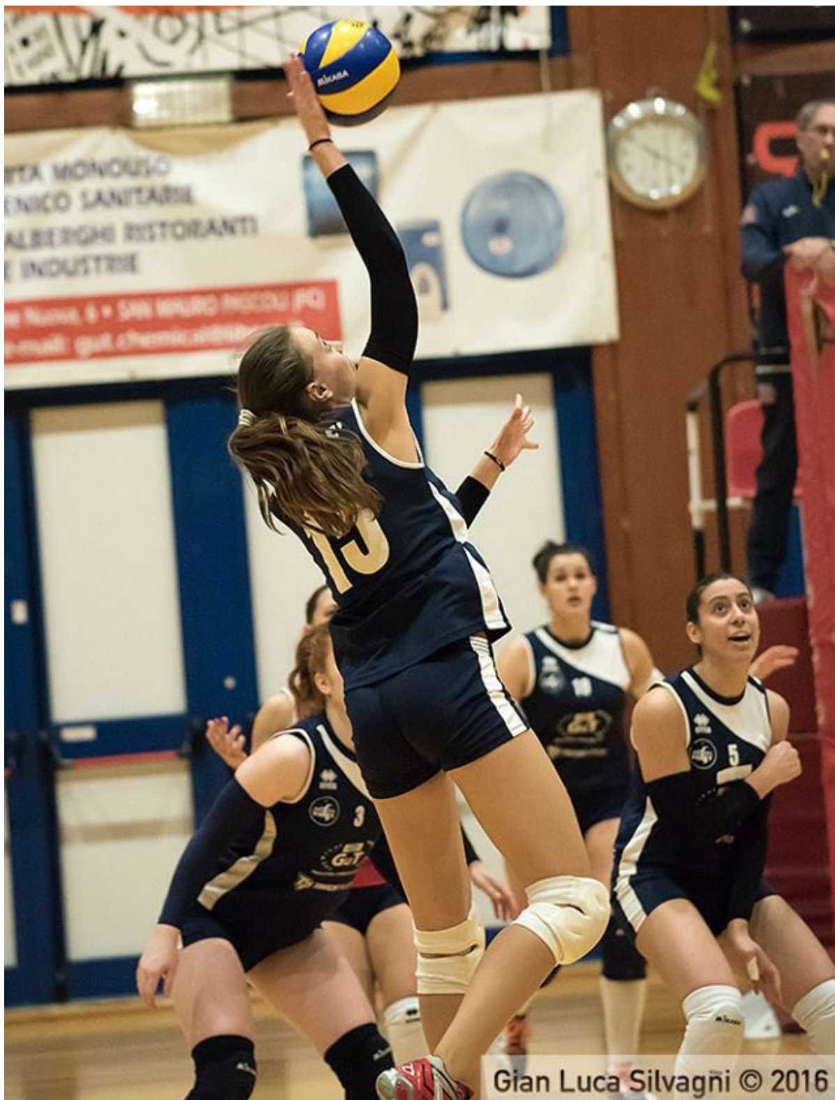
Gian Luca Silvagni © 2016