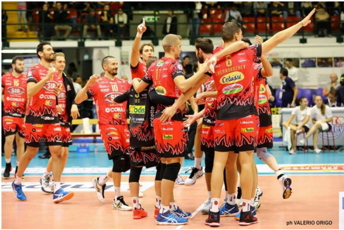
ph VALERIO ORIGO