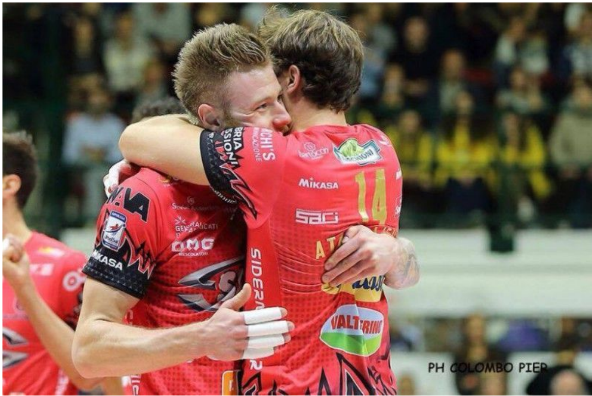
PH COLOMBO PIER