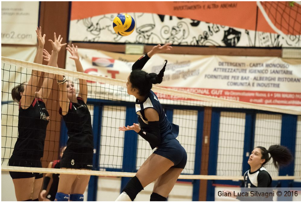
Gian Luca Silvagni © 2016