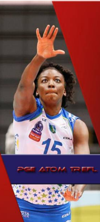
PGE ATOM TREFL